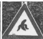
„Vorsicht Banane!“ Das Warnschild steht in Stellmachers Museum genau richtig. Dort wimmelt es von Krummen Dingem!

Ob dieser „Bananomat“ wirklich mal funktioniert hat? Dann hätten die Nutzer tolle Schnäppchen gemacht: Banane reinstecken, zwei Mark entnehmen.